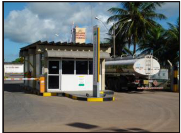
“Donos” do Terminal Cabedelo se acham acima da lei

Contudo, os “donos” do terminal de Cabedelo são imunes e estão acima de toda lei e procedimento interno. Essas normas